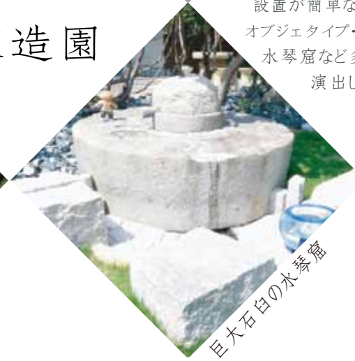
巨大石臼の水琴窟