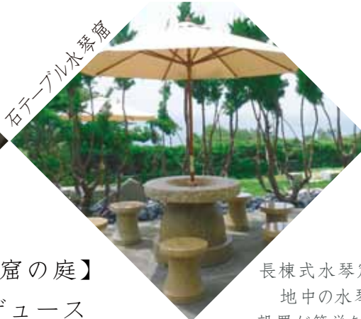
石テーブル水琴窟